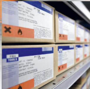
Für Kunden aus der Autoglasindustrie, dem Autoglasgroß- sowie Kfz-Teilehandel und Autoglas-Fachbetrieben hat PMA/ Tools die komplette Palette für Monta- ge-, Zubehörteile und Werkzeuge für die Autoglasmontage im Programm.