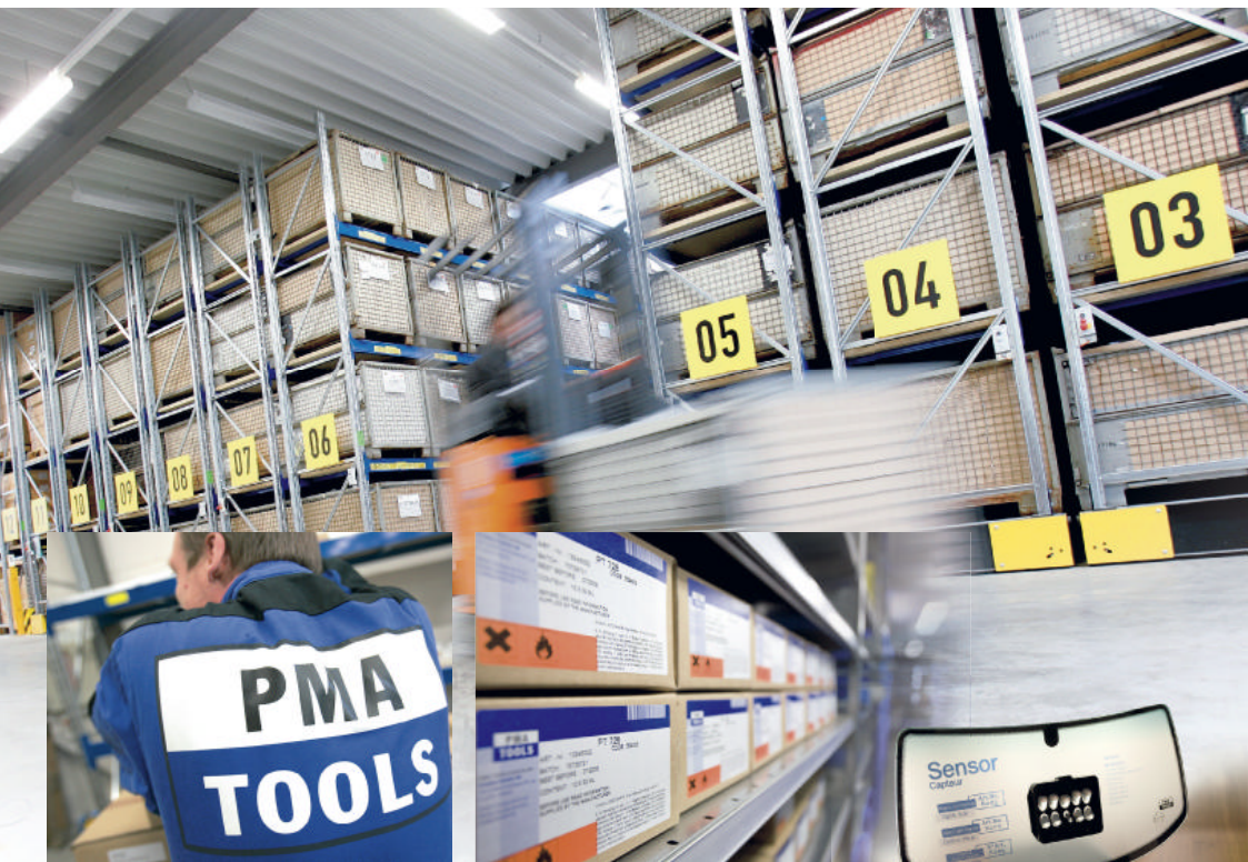
Die PMA/Tools AG ist Spezialist für alle Montage- teile, Zubehörteile und Werkzeuge, die für einen Scheibenwechsel notwendig sind.