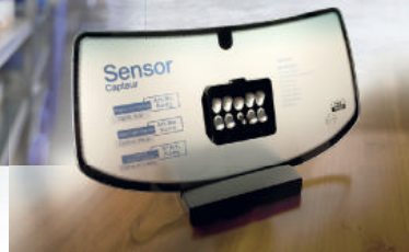
Neue Ideen für individuelle Lösungen und zeitnahe Umsetzung treiben PMA/Tools voran.